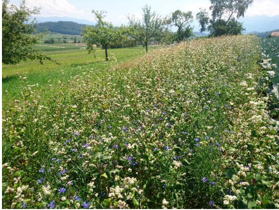
Figure 3 : Bandes semées pour organismes utiles dans une culture de choux.

*** Selon les PER, une pause de 2 ans au même endroit s'applique aux bandes semées pour organismes utiles, comme pour les autres grandes cultures.